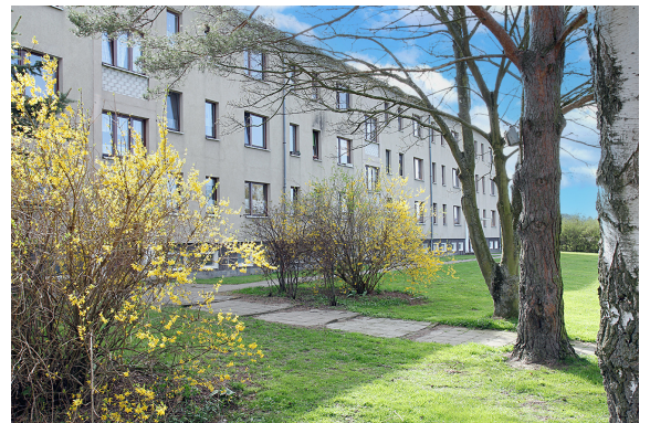
Hessenburger Str. 1, 3 und 5